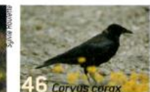
46 Corvus corax Michel Emieux

48 balade autour du Mont-Saint-Michel Pierre Mercier de Beauvoivre