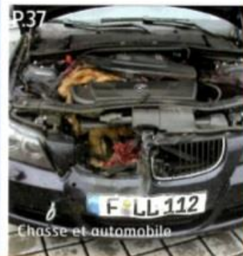
P.37 Chasse et automobile